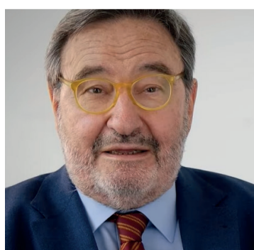
Narcís Serra primer secretari del PSC del 1996 al 2000