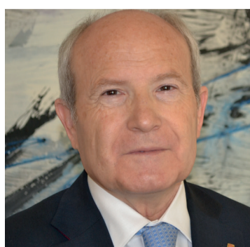
José Montilla primer secretari del PSC del 2000 al 2011