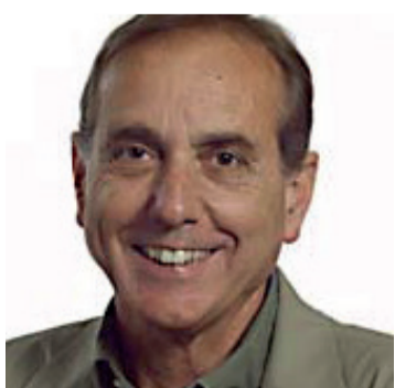
Raimon Obiols primer secretari del PSC del 1983 al 1996

Com a exprimers secretaris del PSC, avui el primer partit de Catalunya, demanem un suport majoritari al paper que avui juga la nostra formació política, en una hora que és a la vegada d'esperança i preocupació; una hora que no serà fàcil, però que pot ser la de les solucions de fons.