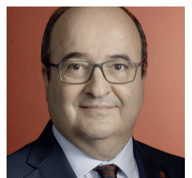
Miquel Iceta primer secretari del PSC del 2014 al 2021