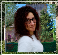
TRINIDAD MAEZO INVIRTAMOS EN DEPORTE