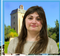
EVA CELMA HABITATGE PER JOVES